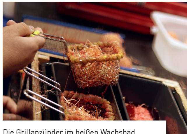
Die Grillanzünder im heißen Wachsbad.